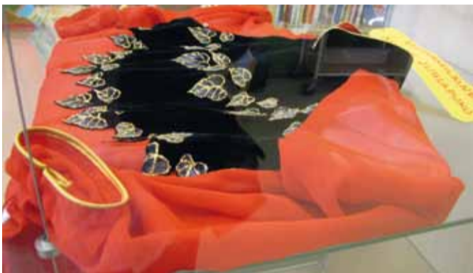
Nummen kirjaston lastenosastolla on esillä 19. toukokuuta 2011 saakka Opetuskoti Mustikan ja Turun kristillisen opiston maahanmuuttajanaisten suomen kielen opetuksen näyttely, jossa on esillä kurdilainen ja vietnamilainen (kuvassa) juhlapuku ja pieniä tarinoita naisen elämästä.