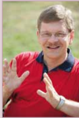
Kirjoittaja on Röntäessä asuva lääkäri ja professori.