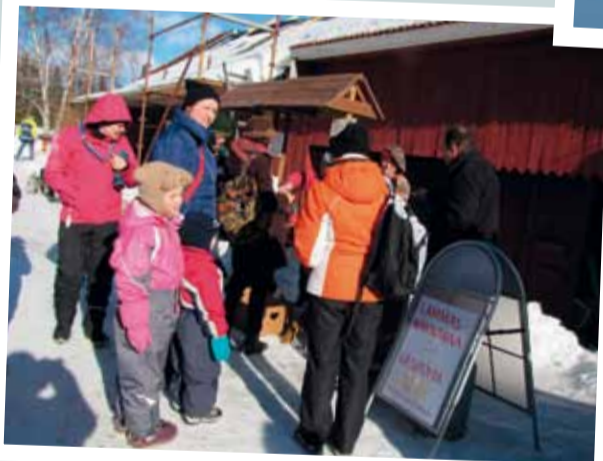
Itä-Maarian aluetyön paistama ahvenanmaalainen lammasmakkara maistui.