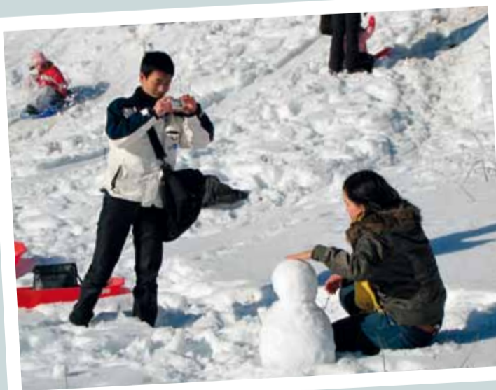
Elämän ensimmäinen lumiukko ikuistettiin jokirannassa.