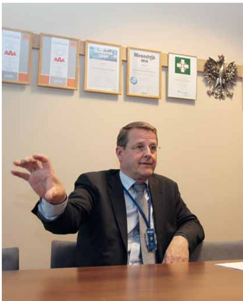
”Kaikki menee kaupaksi, kunhan hinta on sopiva”

Teksti: Tuula Manner