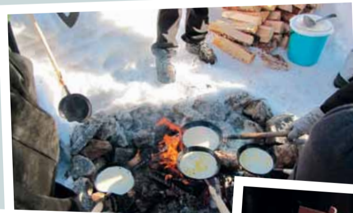
Jokirannassa oli partiolippukunta Maarian kämmekköiden leirinuotio, jossa pääsi paistamaan omat lätyt.