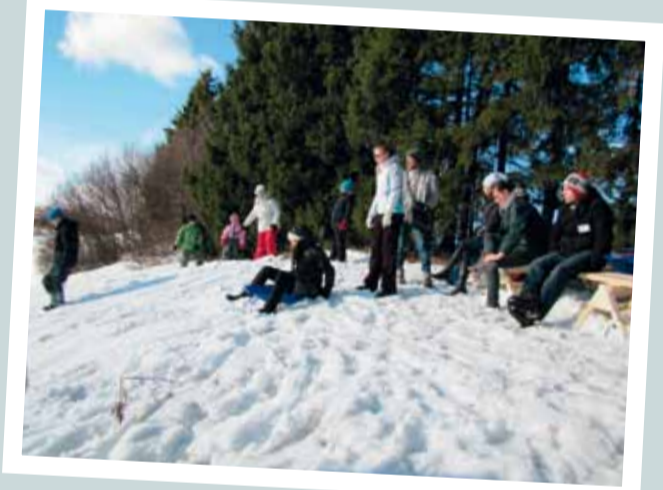
Aurinko lämmitti pulkkamäkeä.