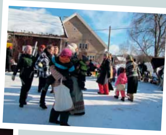
Juurielo veti piirileikkejä pihassa.