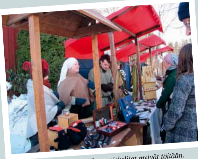
Mynämäen muinaistekniikan opiskelijat myivät töitään.