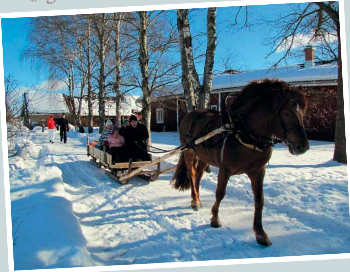
Rekeä veti Taikuri-poika.