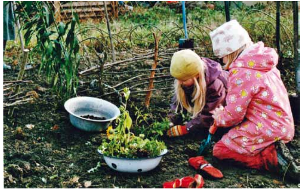
Leikkivallankumous kannustaa lapsia tekemään itse.

Vinkit tekemiseen löytyvät sivuilta: leikkipiha.blogspot.com (jatkuvasti päivittyvä oppimateriaalipankki) www.turku2011.fi/leikkivallankumous (tietoa taustahankkeesta)