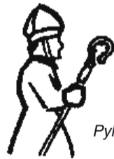
Pyhän Henrikin pyhiinvaellusreitinnunuskuvaa

Vaellus on osa kulttuuripääkaupunkivuoden ja Koroisten kyläjuhlien ohjelmaa.