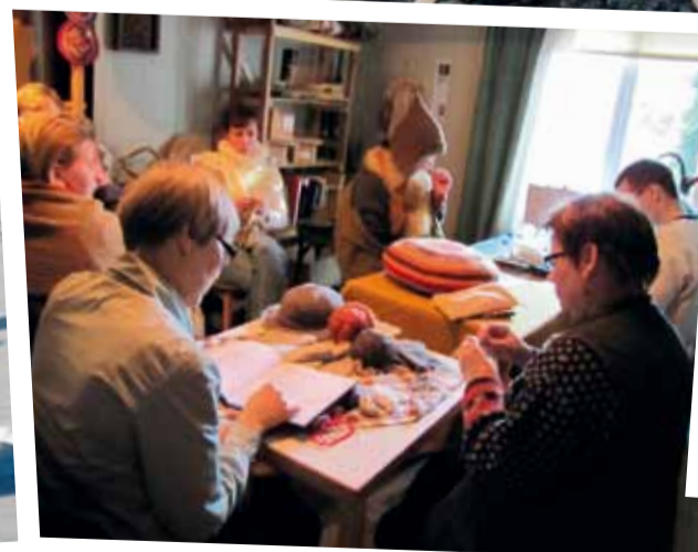
Villanäyttelyn osana oli erilaisia työnäytöksiä villasta.