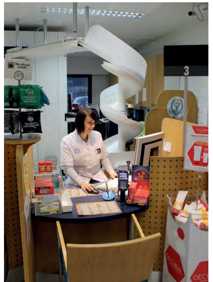
Taustalla näkyvä robotti on väsymätön apulainen.