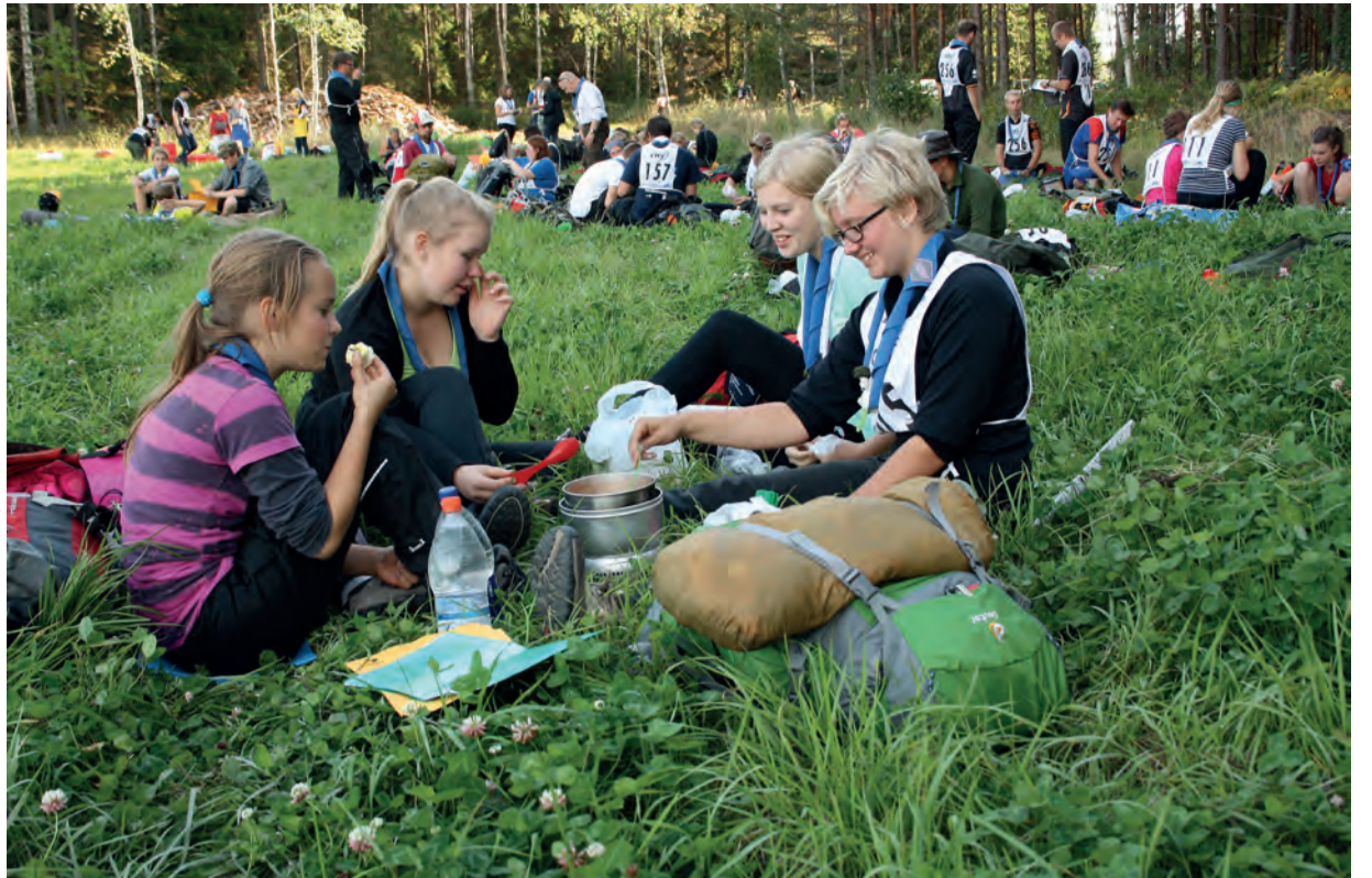
Partiotaitokilpailuissa ehtii välillä herkutellakin.

Hienoa partiossa on se, että siitä voi tehdä juuri itsensä näköisen harrastuksen. Pienestä pitäen partiolaisten pääsevät vaikuttamaan siihen, mitä koloilloissa ja retkillä tehdään. Mahdollisuudet ovat rajattomat, kun tarjolla on kaikkea askartelusta valokuvaamiseen, suunnistuksesta