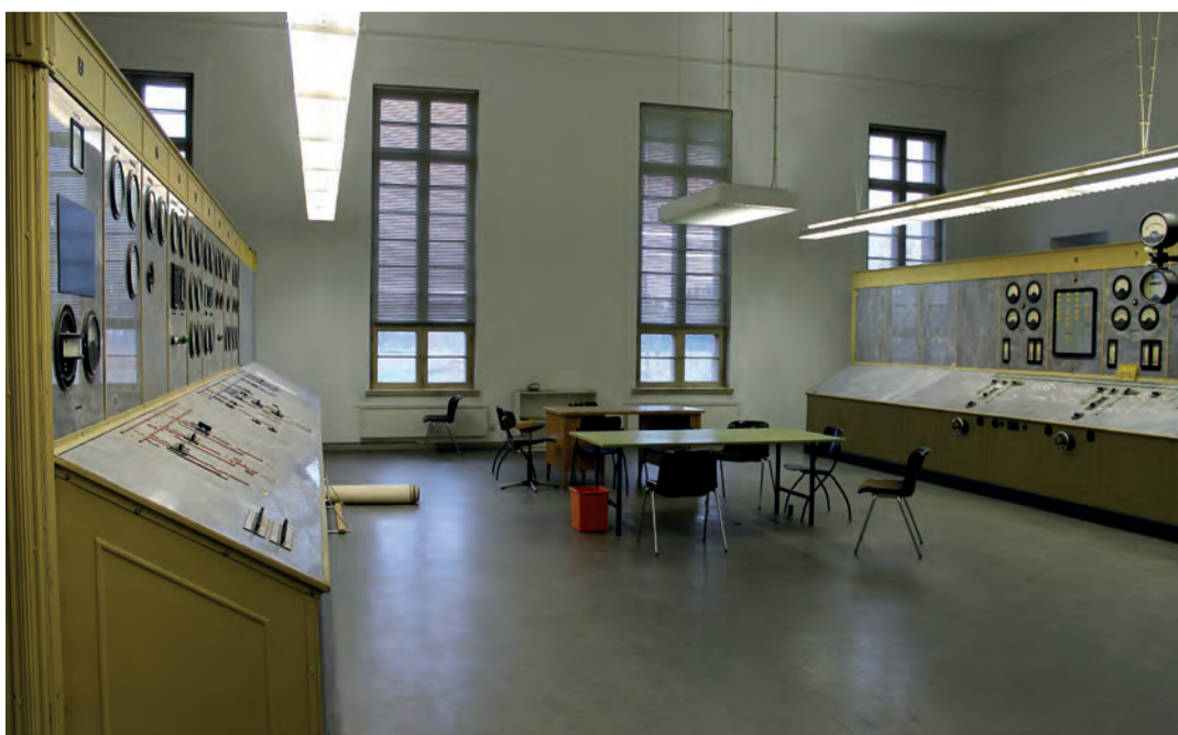
Tyhjilleen jäänyt valvomo nykyasussaan.