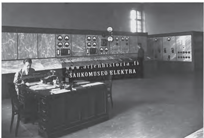
Muuntoaseman valvomo 1930-luvulla.

Pohjoismaisen klassismin esikuvina toimivat niin Pompeijin arkkitehtuuri kuin Italian pikkukaupunkien "architetture minore". Tunnettuja turkulaisia arkkitehtejä 1920-luvulla olivat Alvar Aalto ja Erik Bryggman , jotka vuosikymmenen loppupuolella olivat jo julistamassa funktionalismin läpimurtoa. Tyyliuutauksen muuttuminen funktionalismiin ei tapahtunut yhtäkkiä, vaan rakennusten tyyli yksinkertaistui vähitellen. Kaikkia vuosikymmenen vaihteessa rakennettuja rakennuksia ei edes voi luokitella kuuluvaksi kumpaankaan