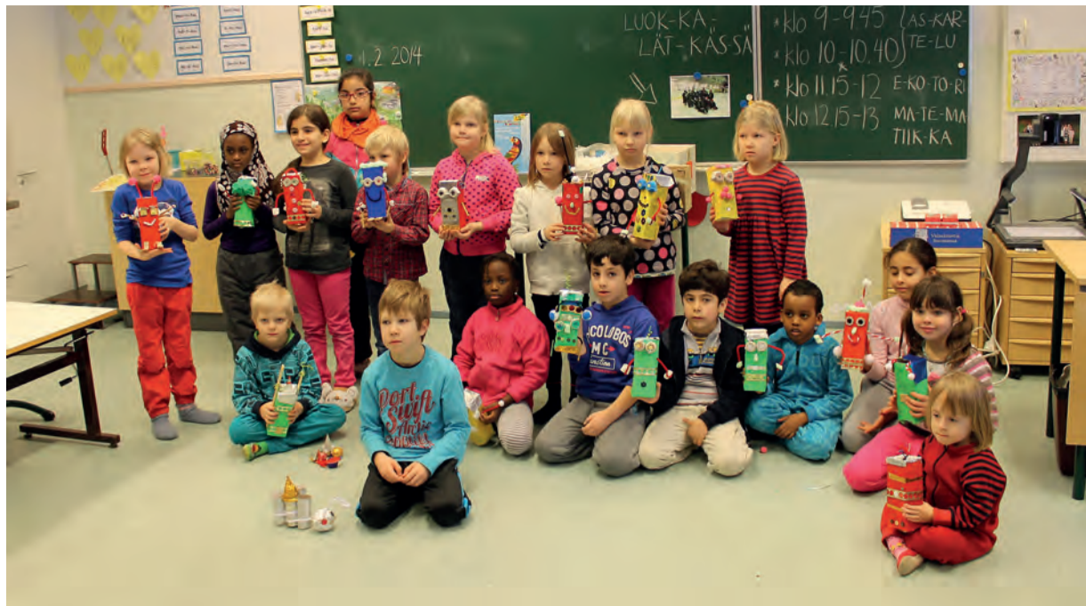
Robotit ja avaruusalukset valmiina lähtöön!