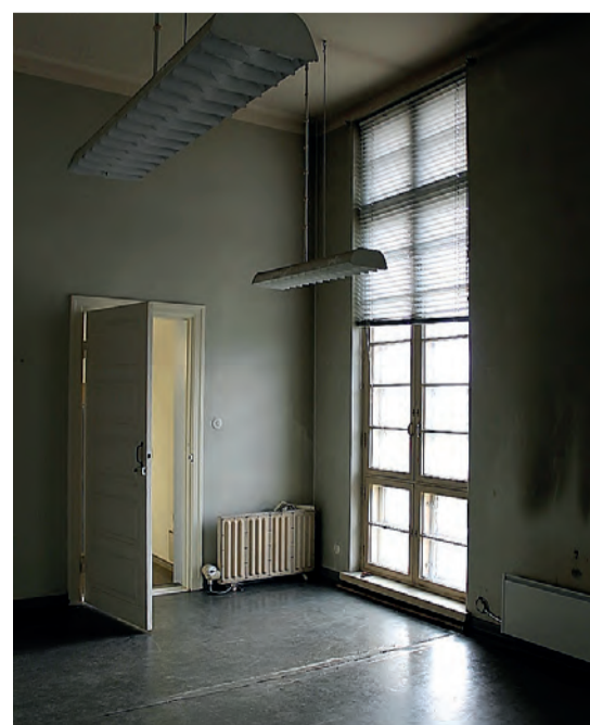
Fiktiivinen Jussi Vares on seikkaillut näissäkin tiloissa.