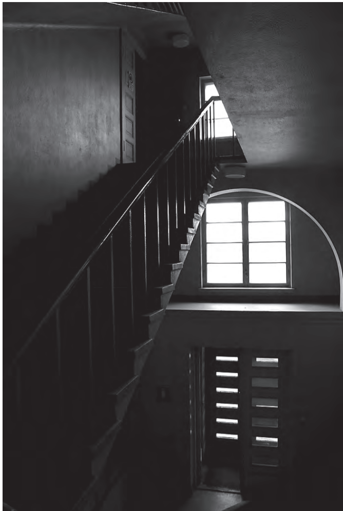
Valon ja varjon funktionalistista kauneutta.