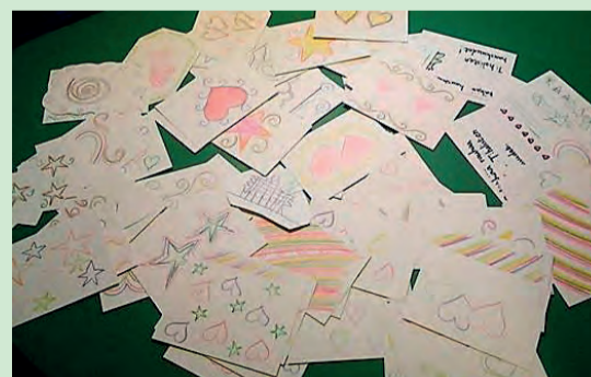
Lasten askartelomia kortteja naapureille.

Halisten hauskuudet, lasten kerho, on ottanut jättiharppauksen palvelun polulle. Olimme pakahtua ilosta kun saimme käyttöömmä tilat Nuntiuskujan kerhohuoneesta. Tämä oli prosessillemme suuri askel eteenpäin, sillä saimme neutraalin tukikohdan, johon kaikki voivat saapua sellaisena kuin ovat, niillä kyvyillä ja vahvuuksilla joita heillä on, niillä haluilla ja toiveilla jot-