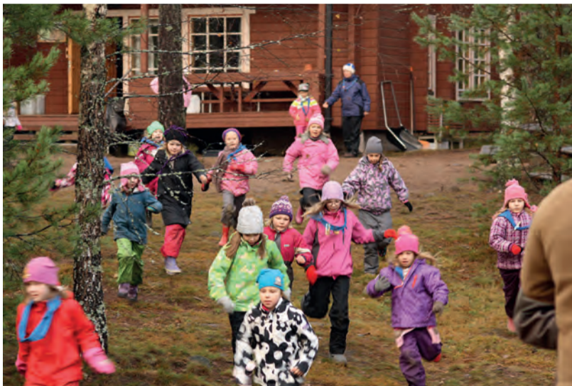
Partiossa menoa ja meininkiä riittää kaikista pienimmillekin.