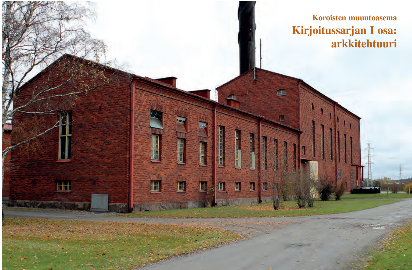
Koroisten muuntoasema Kirjoitussarjan I osa: arkkitehtuuri