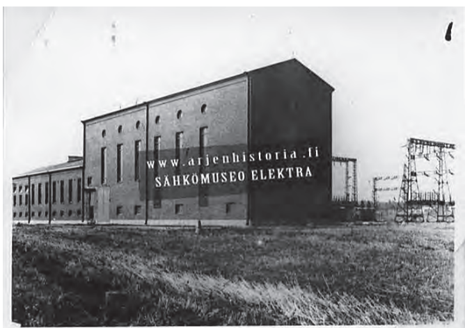
Vastavalmistunut muuntoasema ylhäisessä yksinäisyydessään vuonna 1927.