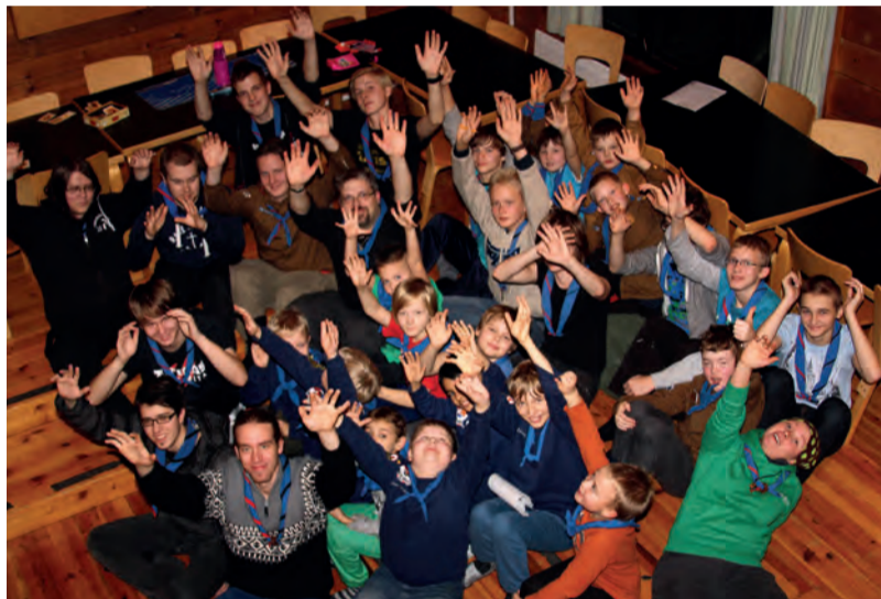
Partiossa kaikenikäiset retkeilevät sulassa sovussa.