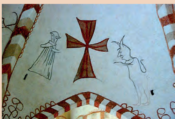
Munkki, risti ja piru – kuva Maarian kirkon maalauksista.