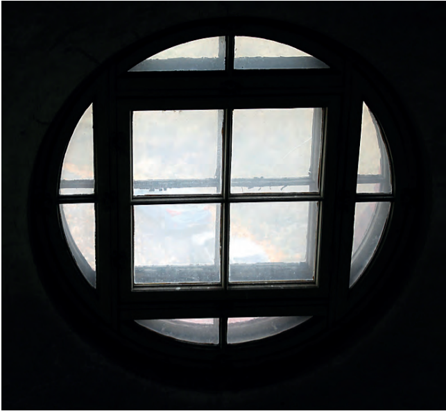
Pyöreän muodon vahvuus yhdistyy kulmikkuuteen.

tyylisuuntaan, vaan tällöin on enemmän kyseessä siirtymätyyli.