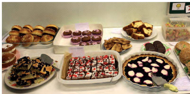
Buffetissa oli suolaista ja makeaa jokaiseen makuun.