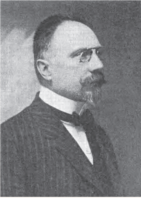
Georg Boldt (1862–1918).