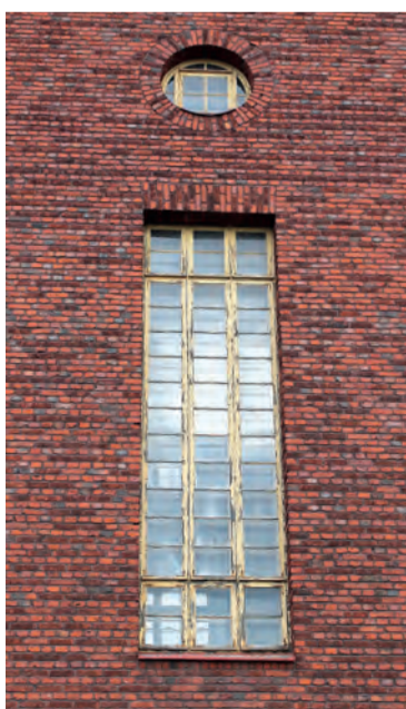
Aseman ulkoseinää hallitsevat aikakaudelle tyypilliset korkeat, pieniruutuiset ikkunat.