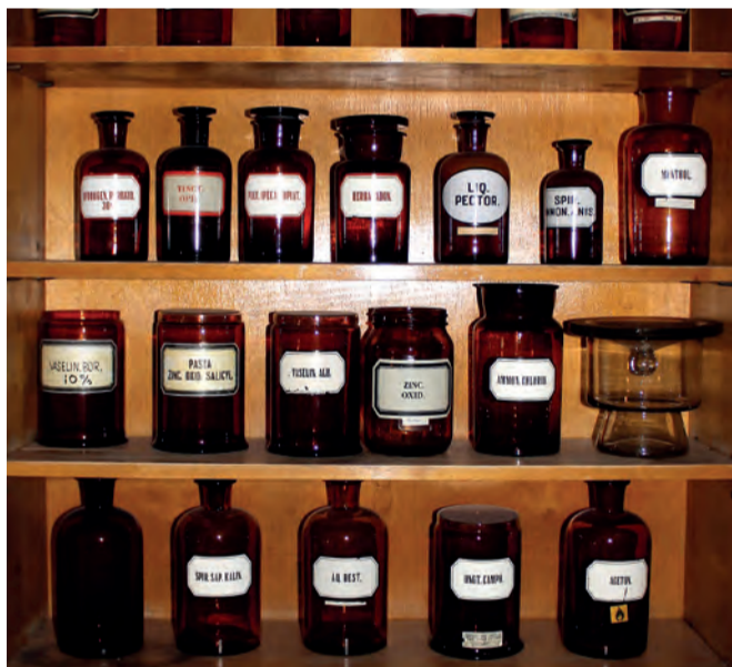
Muistoja apteekin alkua ajoilta.